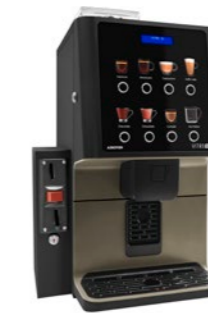
Kit Validierungsmodul Vorbereitet zur Installation eines Münzprüfers.