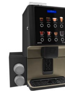
Kit Bechermodule Zum Spenden von Bechern.