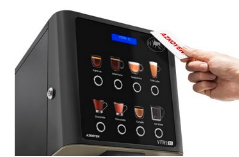
Kit RFID-Lesegerät Für Produktladekarten oder bargeldlose Systeme.