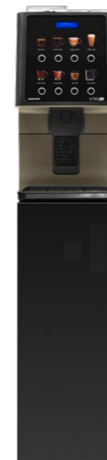
Kit Sockel Vorbereitet für Münzprüfer. (850 mm.)

Auch für den Kaffeeservice in Lebensmittelgeschäften ist sie die perfekte Lösung und für Hotels, in denen das Frühstück gut, aber ebenso schnell sein sollte, bietet die Maschine ein angenehmes Erlebnis, mit einem attraktiven Design, einfach und funktional.